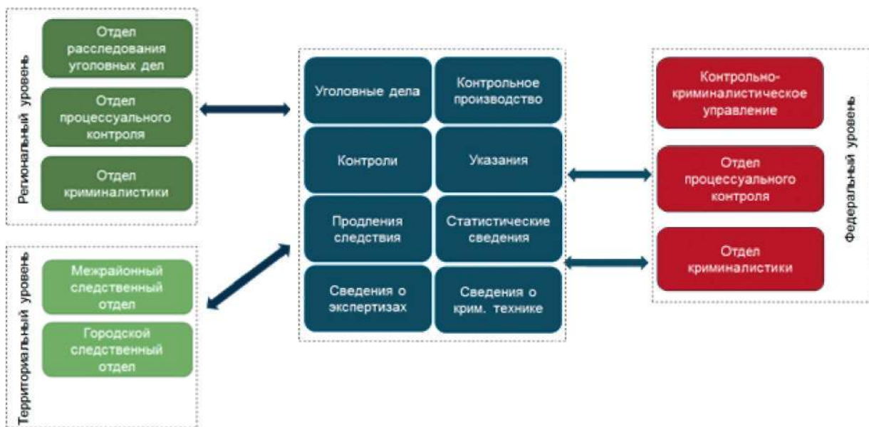
Рис. 2. Обобщенная структурно-функциональная схема информационной системы «Электронный паспорт уголовного дела»

Как следствие, поскольку нормативно-правовая база для перехода на использование электронных документов во всех сферах деятельности Следственного комитета к настоящему времени не создана, каждая подсистема Следственного комитета вынуждена